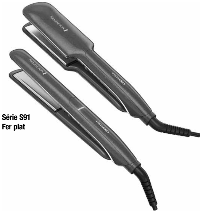
Série S91 Fer plat