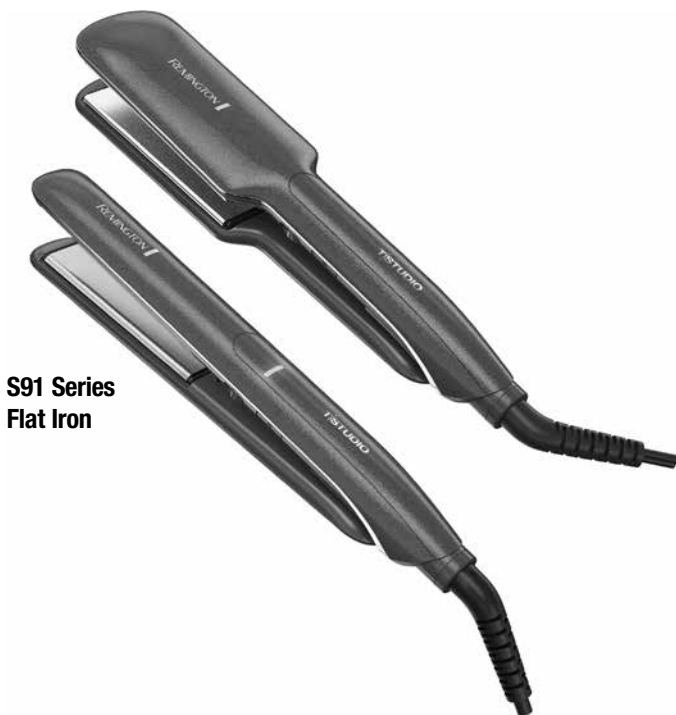
S91 Series Flat Iron