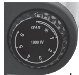
Left control knob