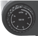
Control de temperatura del lado derecho